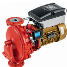
Etaline s motorem SuPremE® IE5, PumpMeter a PumpDrive Eco