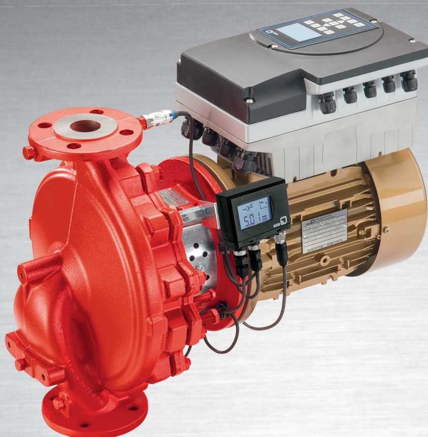
Etaline s motorem SuPremE® IE5, PumpMeter a PumpDrive