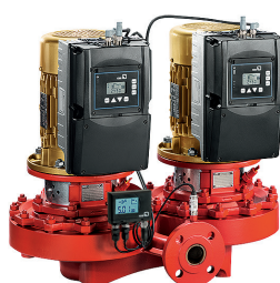
Etaline Z s motorem SuPremE® IE5, PumpMeter a PumpDrive Eco