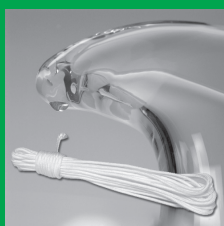
Vázací lanko 15m