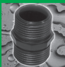
Vsuvka s o-kroužky