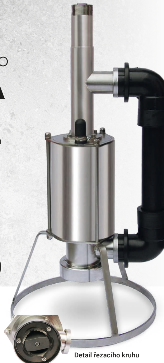
Detail řezacího kruhu